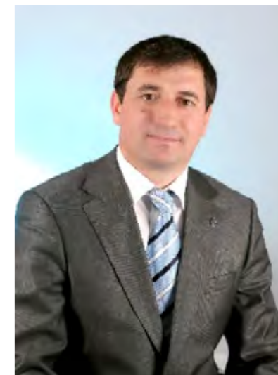
Ф. РАДЖАБОВ ЗАМЕСТИТЕЛЬ ПРЕДСЕДАТЕЛЯ КОМИТЕТА НАРОДНОГО СОБРАНИЯ РЕСПУБЛИКИ ДАГЕСТАН ПО ЗАКОНОДАТЕЛЬСТВУ, ЗАКОННОСТИ И ГОСУДАРСТВЕННОМУ СТРОИТЕЛЬСТВУ

Таким образом, все выявленные нарушения получают соответствующее прокурорское реагирование, в результате чего обеспечиваются реализация и защита избирательных прав граждан.