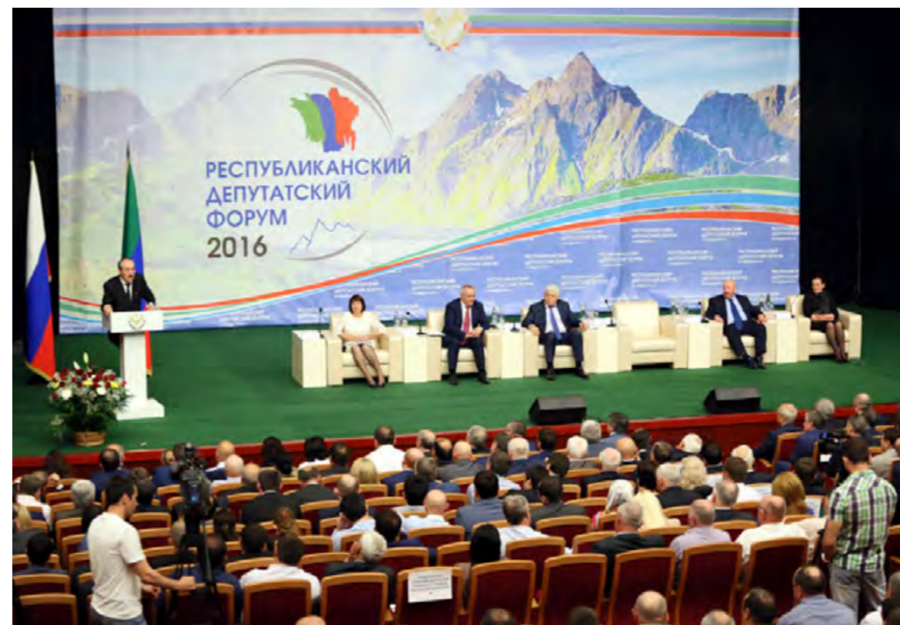
Уполномоченный по правам человека в Республике Дагестан приняла участие в Республиканском депутатском форуме, 31 мая 2016 года