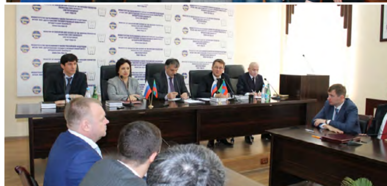
Открытие Центра избирательного права и процесса Дагестанского государственного университета, 3 апреля 2015 года.