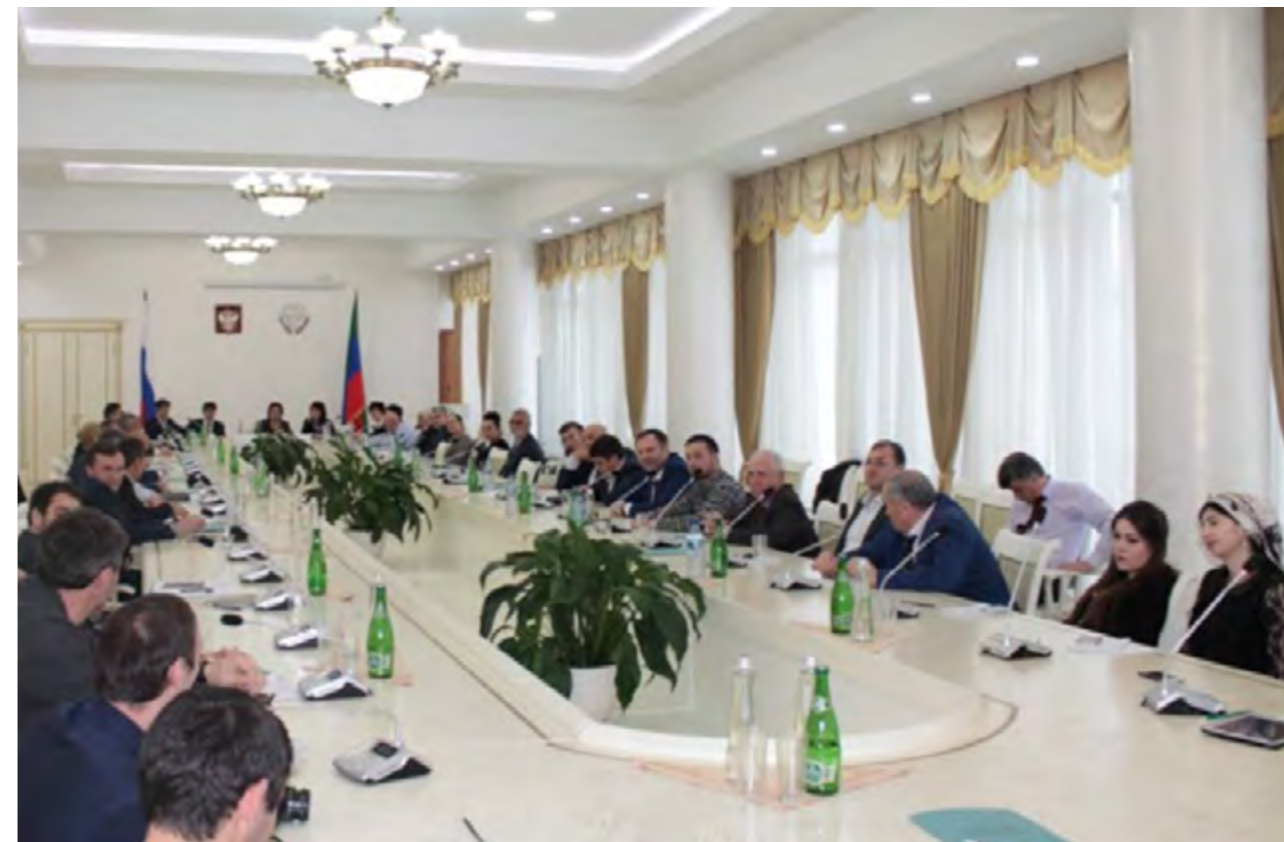
Круглый стол на тему: «Защита избирательных прав на всех стадиях избирательного процесса», 5 апреля 2016 года