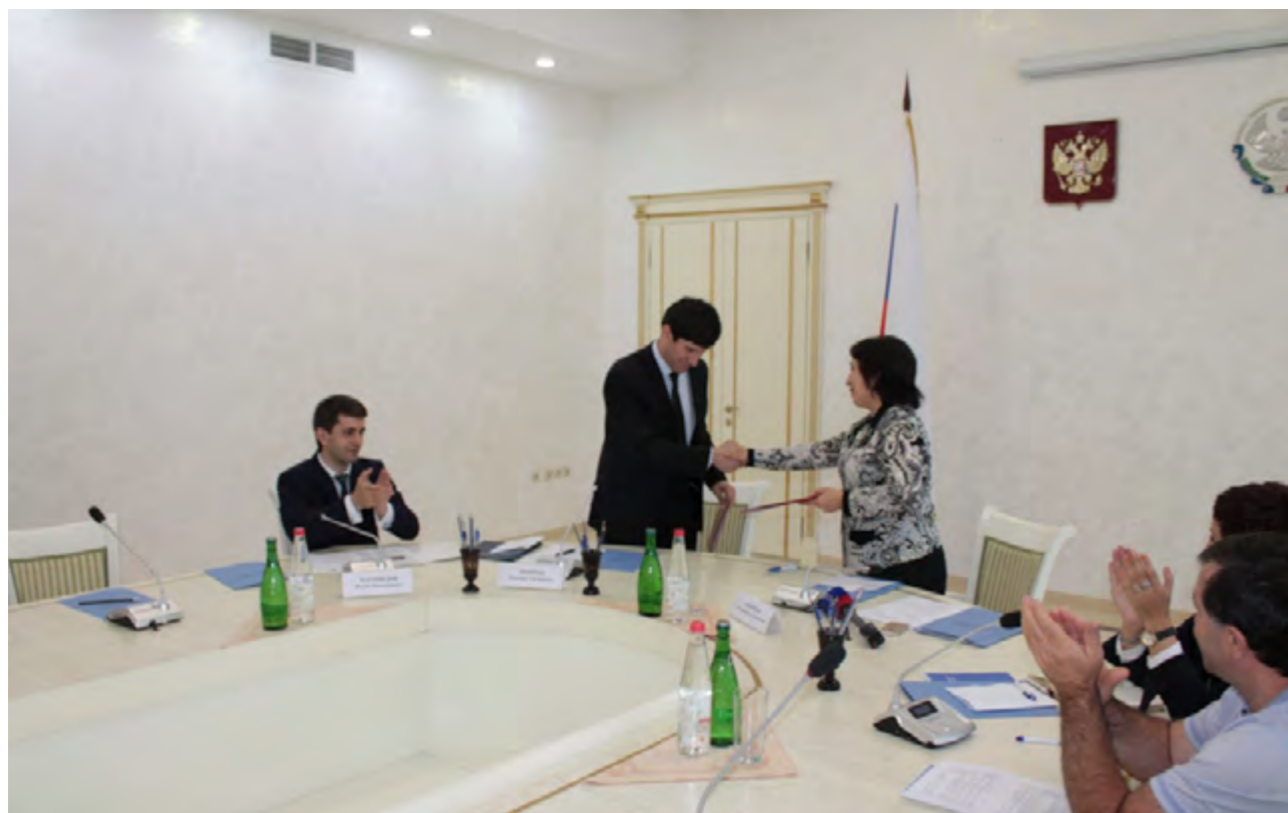
Уполномоченный по правам человека в Республике Дагестан и председатель Избирательной комиссии Республики Дагестан подписали соглашение о взаимодействии, 15 июня 2016 года