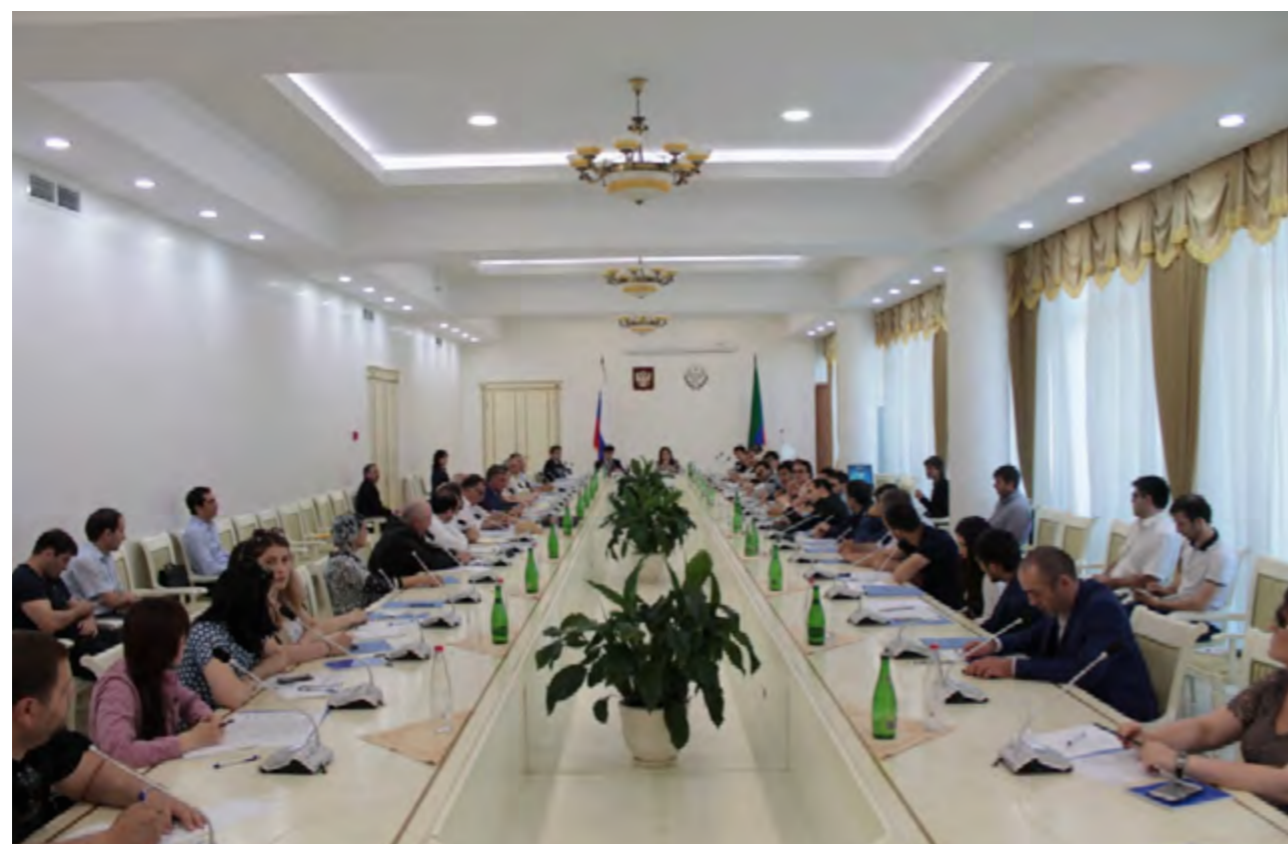
Круглый стол с участием представителей политических партий на тему: «Повышение гражданской активности населения и подготовка наблюдателей для проведения выборов 18 сентября 2016 года», 15 июня 2016 года