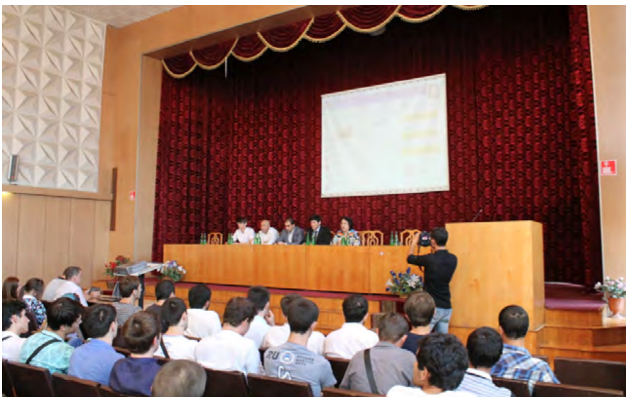
Семинар для студентов-юристов по вопросу «О наблюдении на муниципальных выборах в Единый день голосования 13 сентября 2015 года», 8 сентября 2015 года