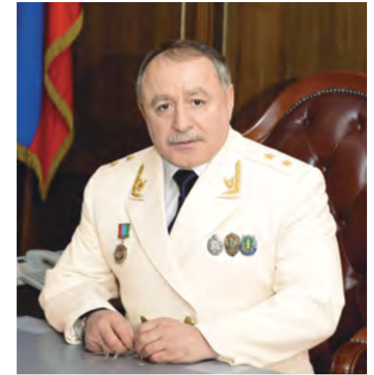
Р. Шахнавазов ПРОКУРОР РЕСПУБЛИКИ ДАГЕСТАН

Прошедшие избирательные кампании показали возросшую зрелость гражданского общества, его вовлеченность в избирательный процесс, что в конечном итоге существенно влияет на открытость избирательного процесса, конкурентность выборов, а также легитимность их результатов.